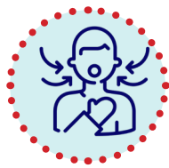
Tengnefesi Bi zehmet nefes wergirtin