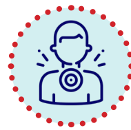
Êşa gewriyê, bi zehmet daqurtandin