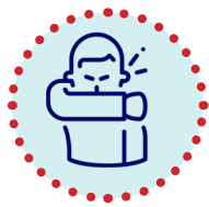
Kûxika nû an ya ber bi xirabtir ve diçe