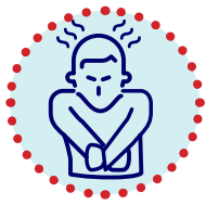
Xelîn, vereşan, hinav çûn