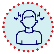
Westaniya nerave, bêhalî, lerizîn, êşa serî